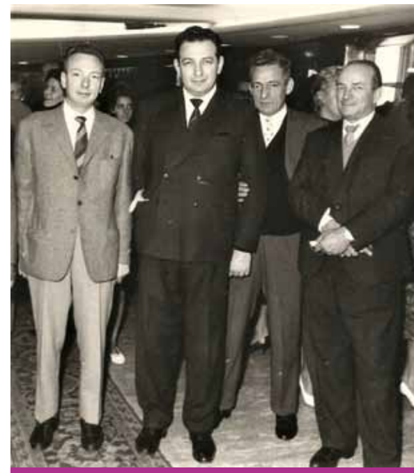
"Benvenuti Hermanos SA es una empresa fundada en 1950 en cuyos inicios estuvo integrada por cuatro hermanos con una clara visión de fabricantes"