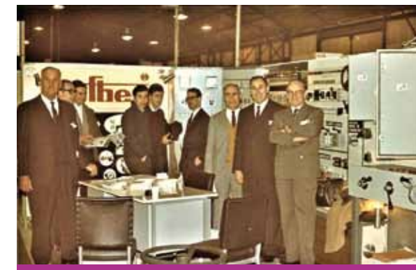
"Si bien la empresa se presentaba en toda exposición que se realizaba, el cambio se produciría cuando participó de la 3ª EMHA"

Mientras que en el mercado existían problemas de generación manifestados por tensión de línea muy fluctuante, sumados a cortes repentinos de tensión, la línea de selectores iba creciendo, llegando a lo que sería la línea completa, desde 5 hasta 160 A, y se fueron agregando selectoras voltimétricas y amperométricas, las primeras desarrolladas de manera totalmente artesanal.