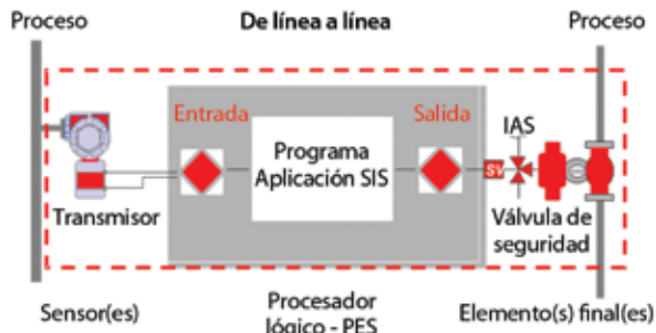
Figura 1. Definición de "sistema instrumentado de seguridad"

yendo entradas, salidas, fuente de alimentación y unidades lógicas.