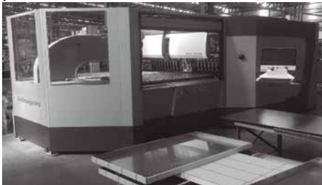
Figura 2. Salvagnini, paneladora automática