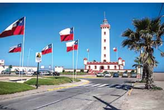
Figura 3. Faro de La Serena, emplazado en la playa, en la intersección de las avenidas Del Mar y Francisco Aguirre

Luxamérica es organizada en cada ocasión por la asociación o entidad de iluminación representativa de cada país anfitrión. En nuestro país, es la Asociación Argentina de Luminotecnia (AADL).