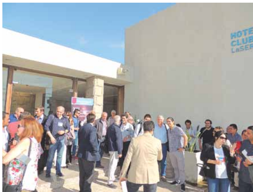
Figura 4. Asistentes durante un intervalo del congreso, en el frente del hotel Club La Serena, sobre la avenida Del Mar

Luxamérica 2016 fue organizada por la Fundación Chilena de Luminotecnia (FCL) en conjunto con la Oficina de Protección de la Calidad de los Cielos del Norte de Chile (OPCC) y la Universidad de La Serena, quienes llevaron a cabo el XIII Congreso Panamericano de Iluminación - Luxamerica 2016. Sin dudas fue uno de los eventos más relevantes del año en materia de iluminación en Sudamérica, permitiendo reunir a connotados profesionales luminotécnicos, empresarios, aca-