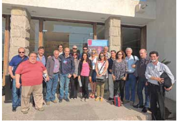
Figura 11. Acto de cierre de Luxamérica 2016, con la participación de casi todos los argentinos asistentes