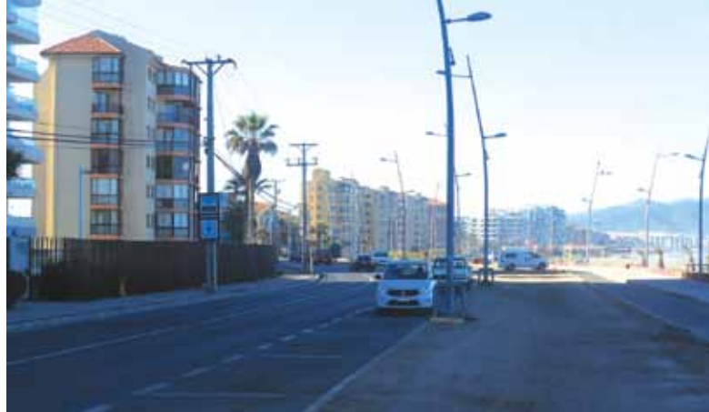
Figura 2. Costanera, Avenida Del Mar en La Serena, donde se realizó el congreso Luxamérica 2016, con vista al mar.

Para los amantes de la poesía, La Serena y sus alrededores es conocida también como la ciudad donde muy joven comenzó con su actividad profesional Lucila Godoy Alcayaga, docente y poetisa chilena, quien más tarde adoptara el seudónimo de "Gabriela Mistral", Premio Nobel de Literatura en el año 1945 (la primera escritora de lengua española en acceder al galardón), y en 1951, premio Nacional de Literatura de Chile. Al recorrer la ciudad de La Serena, se pueden apreciar inmuebles donde Gabriela Mistral convivió con sus familiares (madre), como la Casa de la Palmera, antigua casona del siglo XIX ubicada sobre la avenida Francisco Aguirre, que lleva al faro de la ciudad; o la casa de la Compañía Baja, donde dio sus primeros pasos como profesora.