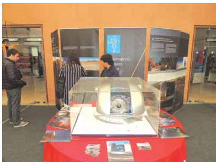
Figura 5. Stand del observatorio emplazado en la feria Expoluz, en Luxamérica 2016

La novedad en el evento luminotécnico fue contar con la participación de entidades astronómicas como ser el Observatorio AURA ( Associated Universities for Research in Astronomy Observatory , 'Universidades Asociadas para la Investigación en Astronomía Observacional'), y otros de la región de Coquimbo y alrededores, que presentaron sus actividades científicas, turísticas e inversiones en la materia.