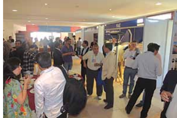
Figura 6. Asistentes a los stands de la feria Expoluz, en uno de los cortes del congreso Luxamérica 2016