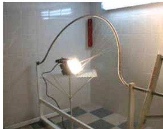
Ensayos de seguridad