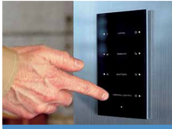
Figura 2. Domovea

Gracias a estos sistemas de domótica, es posible mejorar la casa: controlar el hogar en cualquier momento, desde cualquier lugar; personaliza las luces,