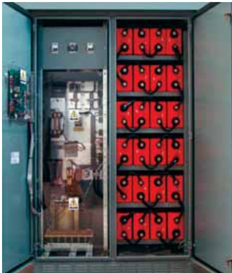
Baterías PowerSafe SBS. Celdas de 2 Vcc y monoblocks de 12 Vcc