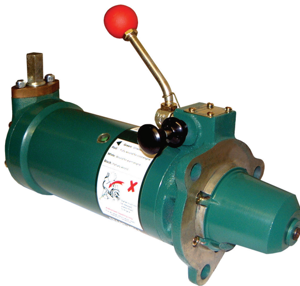
Motor a resorte.

La operación manual garantiza no solo el arranque, sino también la vida útil de los motores, superando décadas de correcto funcionamiento. Asimismo, no se ven afectados por largos períodos de desuso, ni por ambientes húmedos, fríos o extremos, razón por la cual satisfacen requisitos operacionales de aplicaciones como las descritas más arriba: offshore y marinas. Por otro lado, se reducen los costos de batería en casos como bombas o soldadores, y en otros grupos directamente elimina la necesidad de una.