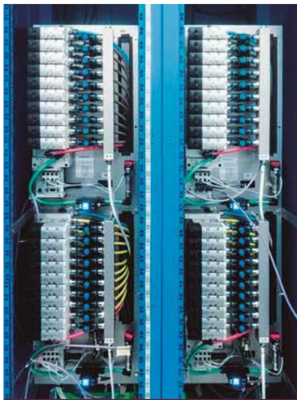
2. Funcionamiento reversible: mediante vacío, el terminal de válvulas VTSA conduce las corrientes de aire desde unas cien estaciones de medición hasta los dispositivos de análisis.

Entre estos factores también se encuentra la composición del aire ambiente y respirable en las cavernas subterráneas en las que se realizan los experimentos. Por ello, a fin de garantizar un