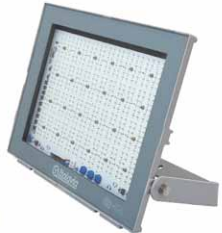
Onix 2 D.O.B.

El otro equipo disponible es Onix 2 D.O.B. Presenta características constructivas similares a las de Onix 2 Prof , aunque suma un protector antitransitorio de red. En este caso, los modelos son también de 100, 150 y 200 W, pero sus luminosidades son 12.000, 18.000 y 24.000 lm.