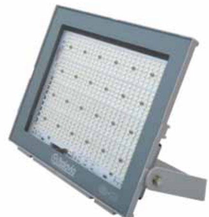
Onix 2 PROF.