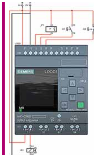
Figura 1. Esquema eléctrico simplificado, donde están representados los órganos que intervienen solo en el cargador de piezas

Las tres acciones que debe realizar el técnico son: