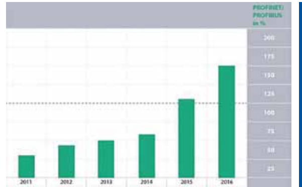
Figura 2. Relación entre nodos Profinet y Profibus

PI lleva a cabo una auditoría anual con el fin de cuantificar los nuevos nodos Profibus y Profinet instalados. Según la auditoría de 2016, cada uno agregó 2,4 y 3,6 millones de dispositivos respectivamente. 2016 fue el primer año en que Profinet vendió más nodos que Profibus, aunque todavía existen más de 56,1 millones de nodos Profibus instalados en todo el mundo.