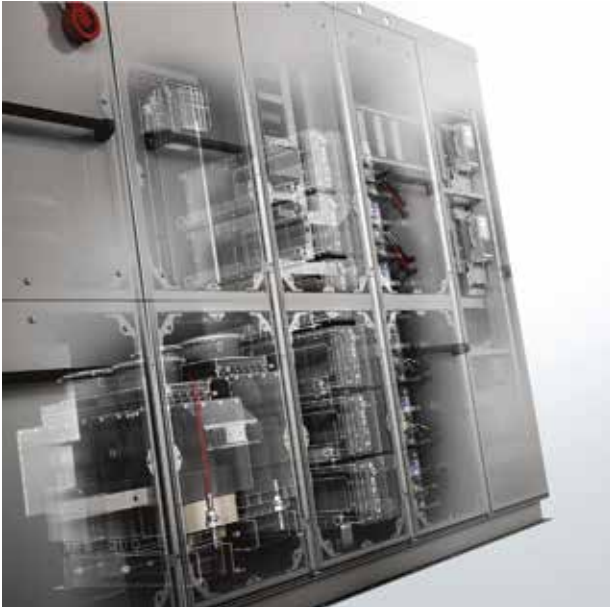
Drive de media tensión de Danfoss: Vacon® 3000

Vacon® 3000 es un drive de media tensión que responde a las necesidades de la industria pesada, capaz de adaptarse a las necesidades con una rápida integración y mantenimiento sencillo.